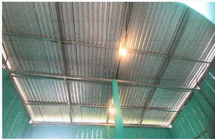
Foto 3: LAMINA TROQUELADA CALIBRE 26 INSTALADA EN EL AULA Y COCINA